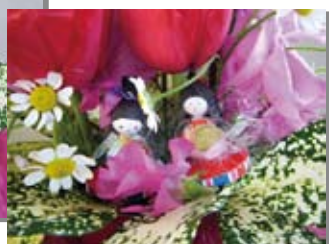
かわいらしいお内裏様とお雛様が♪

※次回（3/12の予定）のテーマは… 『鳥の巣アレンジ（春の芽吹き）』¥2,500